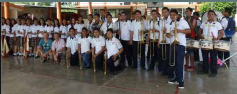
Elèves membres de la fanfare du lycée de San Rafael

C'est justement face à la vision de ce nouveau tempérament culturel, mexicain pour les français et vice versa et avec la rencontre des populations locales que l'on pourra comprendre les influences qu'ont pu apporter ces voyages.